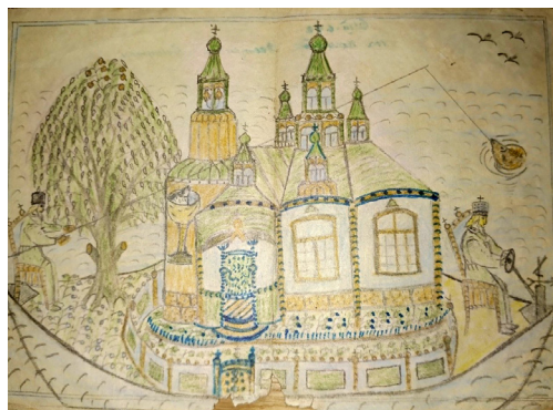
Рисунок 4. Лубок «Церковь-корабль». Figure 4. Lubok Boat Church

Христос удолился из Храма в пустыню, Онъ снова идёт по горамъ, Подать потапающимъ ручку В чёрных житейских волнахъ.