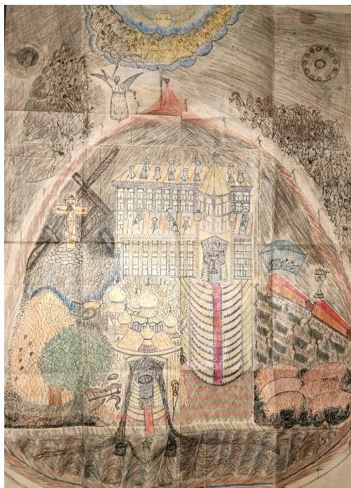
Рисунок 5. Лубок «Лагерь». Figure 5. Lubok Camp

центральная овальная часть — картина земного мира, а не загробного суда. По левому и правому полю — обнаженные грешники, одни (слева) обращены лицом к краю (в верхней части композиции помещено небесное воинство — с крыльями, трубами и мечами. Над воинством в круге сокращение: «Б.Д.с.», «Б.с.», «Б.о.» — новозаветная Троица: Бог дух святой, Бог сын, Бог отец), другие (справа) падают в бездну. Овальная центральная композиция выхвачена светом фонаря и окружена то ли забором и колючей проволокой, то ли электрическими проводами. В центре Кремль с красной пятиконечной звездой на башне, у башни три чаши для причастия, в каждой по две рыбы. Справа рыболовная сеть 23 , ещё одна чаша для причастия с рыбами, но на ней знак «яд». Под ней могилы и гробы с крестами. Слева голгофа с распятым Христом, рядом поверженные кресты. Там же дерево с жёлтой листвой 24 , из него торчат