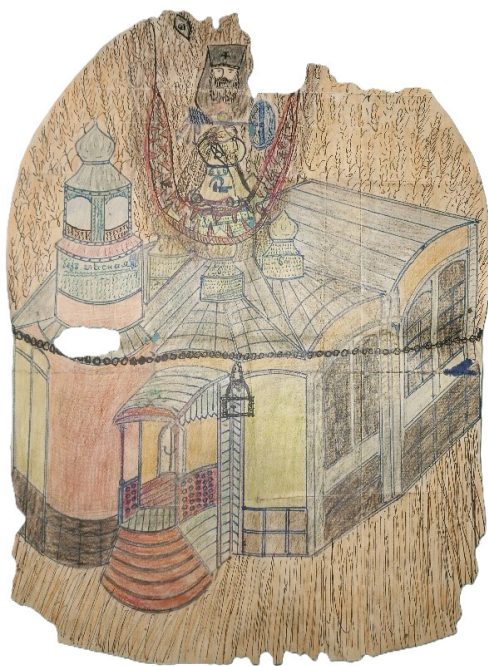
Рисунок 6. Лубок «Поруганная церковь». Figure 6. Lubok Desecrated Church

птичьи головы, под ним нора и лиса, рядом зеленеет другое дерево и пенёк, у которого свернулась змея. У корней дерева мост, над ним число 666, под ним серп. В центре также пяти купольный храм с крестами и колокольней. Перед ним источник или колодец с ведром. Вокруг храма цепь с замком (указание на закрытие храмов в советский период). На переднем плане пасётся шесть свиней. На лубке есть привычная христианская символика — голгофа, храм, дерева с птицами (душами людей), картина запустения (свиньи) и т.п. Мелетий обращается к зрителю через эту сложную композицию и указывает на отсутствие спасения и благодати в официальной церкви, гонения со стороны власти и скорое возмездие со стороны небесного воинства.