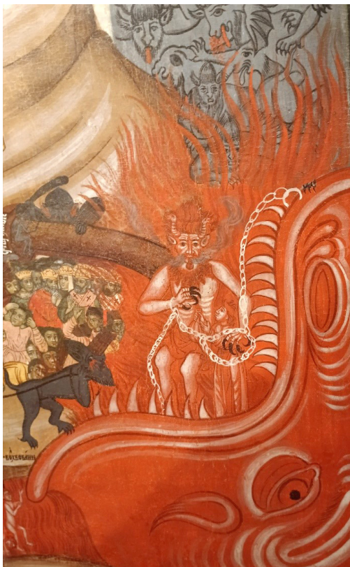
Рисунок 2. Фрагмент иконы «Страшный Суд». МРИ им. Михаила Абрамова. Первая четверть XVIII в. Тверь (инв. ЧМ-182) 15 . Figure 2. Fragment of the icon The Last Judgment . Collection of the Museum of Russian Icons by M. Abramov. Tver, 18th century. (ЧМ-182).

В своём сочинении об истории местного сообщества, написанном для его участников, Мелетий ссылается на авторитет дореволюционного духовенства и непосредственно патриарха Тихона: « протоиерей Булгаков написал ... о рассмотрении назревающего губительного строя, так именуемого марксизма... Патриарх Тихон... проклял вместе и одновременно Сергия и весь их синод, а также совет. власть ещё в 1918 г. » 16 .