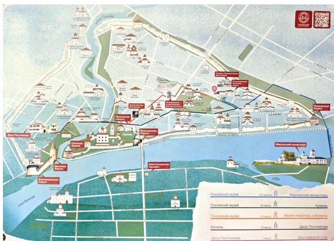
Рисунок. 2. Карта Пскова для пешего туризма. (Фото автора 2025 г.)

Впору говорить о состоявшемся обособлении в исторической науке комплексного новгородоведения и пскововедения — настолько обширны, разнообразны по своему содержанию и методологии перечисленные выше издания (а также сотни им подобных, не вошедших в силу ограниченности объема в библиографический список к этой статье). В эту многоплановую панораму, по нашему убеждению, удачно вписывается и семиотика архитектуры (не в последнюю очередь культовой) 13