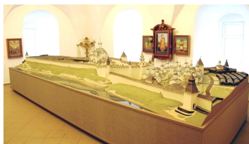
Рисунок 4. Большой макет Псковского кремля. 24 Figure 4. Large model of the Pskov Kremlin.

Псковско-новгородский кейс сподвиг нас применить эту оптику к псковскому кромю и по-новому взглянуть на «ожерелье» из 18 церквей (чьи фундаменты сохранились), некогда опоясывавших в несколько ярусов холм, на вершине которого поныне возвышается Троицкий собор, венчающий всю архитектурную композицию 21 . Благодаря усилиям историков, археологов, реставраторов псковского средневекового зодчества (Ю. П. Спегальскому 22 , Г. Я. Мокееву и их единомышленникам), сакральная топография «дома Святой Троицы» реконструирована достаточно скрупулёзно, во всех деталях 23 (см. рис. 4).