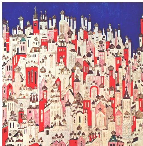
Рисунок 3. Гончарова Н. С. Град. Театрально-декоративное панно. (Париж, 1926) 20 Figure 3. Goncharova N. S. Grad. Theatrical decorative panel. (Paris, 1926)

действие, ровно так же, как на фоне иконостаса с аркатурно-колончатыми поясами темплов разворачивается богослужение.