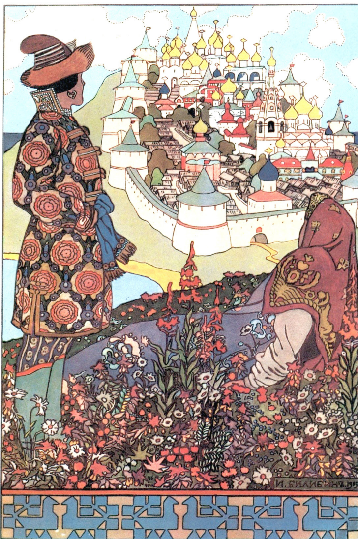
Рисунок 6. Билибин И. Я. «И дивясь, перед собой видит город он большой...» 29 Figure 6. Bilibin I. Ya. "And, amazed, he sees a large city before him..."