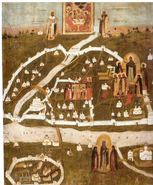
Рисунок 1. Видение старца Дорофея с планом Пскова 1

XVIII в. «Видение старца Дорофея с планом Пскова» (см. рис. 1), ныне хранящаяся в Псковском государственном объединённом историко-архитектурном и художественном музее-заповеднике, не отражает искомый топос храмостава, поскольку иконописцем тогда преследовались совершенно иные цели (о чём речь будет вестись нами в другой раз).