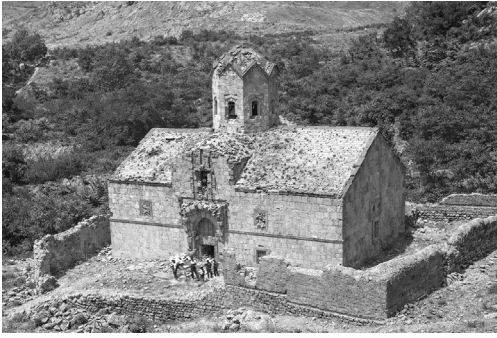
Рисунок 3. Церковь Сурб Степанос в Агулисе, XII–XIII вв. (фото № 36) 30 .