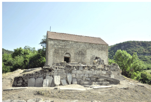
Рисунок 2. Церковь Сурб Степанос монастырского комплекса Вачар, Мартакертский район, XIII век. 29 Figure 2. Church of Surb Stepanos, Vachar Monastery Complex, Martakert District, 13th century.

В Арцахе реликвии святого хранились в монастырях Хадай (Хтраванк) [Սլժժանի, 1953: 78]. В Гардманском уезде Арцаха находится монастырь Таргманчац, где хранилась реликвия св. Стефана Первомученика, подаренная монастырю епископом Игнатием в 1558 г. 25 В одной из надписей церкви городского поселения Вачар 26 в Арцахе отмечается, что здесь в 1229 г. также находилась реликвия святого Стефана Первомученика 27 (Рис.2). В церкви Святого Стефана в Агулисе хранилась десница святого, украшенная перстнями 28 (Рис.3).